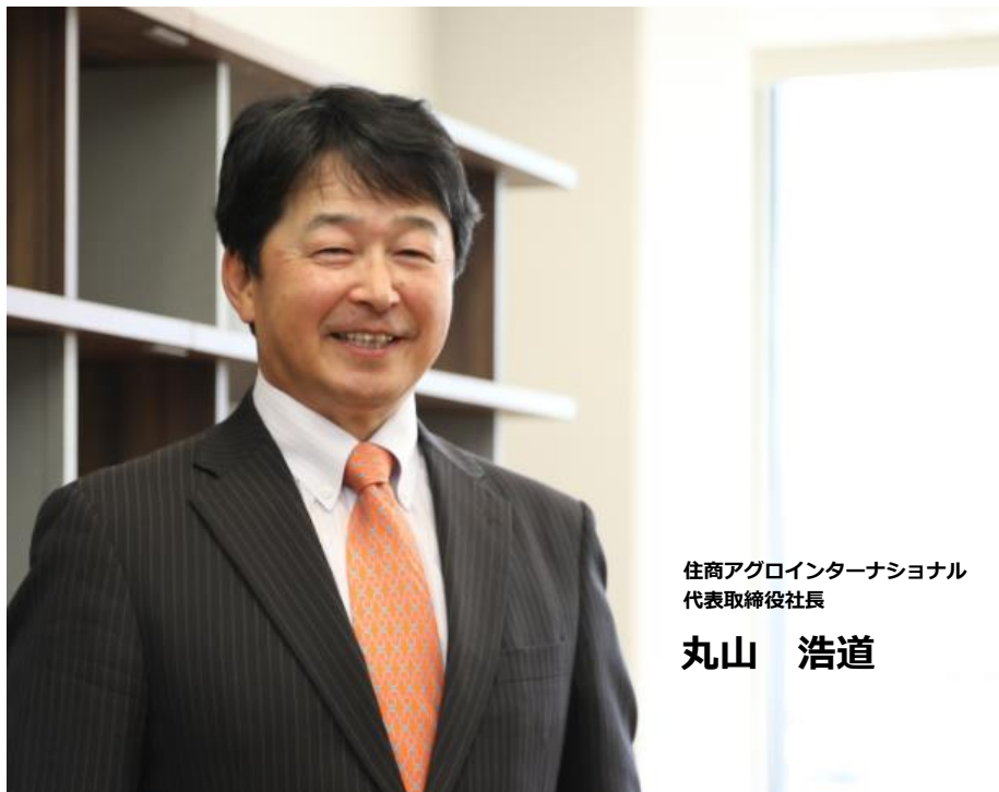
住商アグロインターナショナル 代表取締役社長

私たちは、常に新たな価値を創造し、 お客様に信頼されることをモットーに 業界でNO.1のトレーディングカンパニー を目指します。